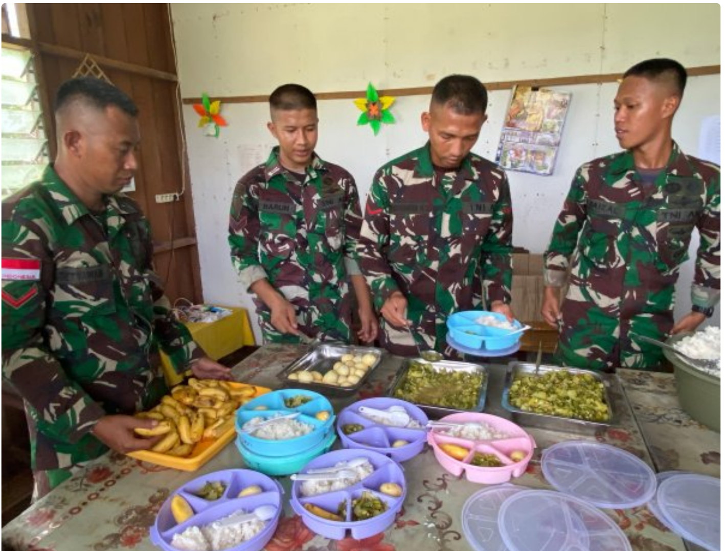
Foto: Dedikasi Satgas Pamtas Mobile RI-PNG Yonif 503/Mayangkara dalam mendukung program makan bergizi gratis pemerintah mendapat apresiasi tinggi dari masyarakat Distrik Krepkuri, Kabupaten Nduga, Papua, di sekolah rimba, Rabu (29/01/2025).

NDUGA- Dedikasi Satgas Pamtas Mobile RI-PNG Yonif 503/Mayangkara dalam